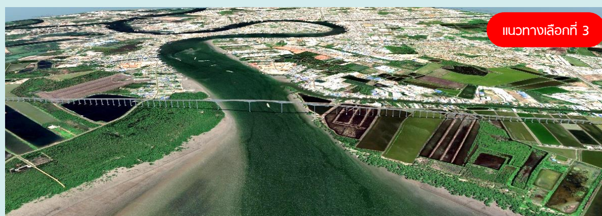
ตัวอย่างรูปแบบแนวทางการเลือกช่วงข้ามแม่น้ำท่าจีน