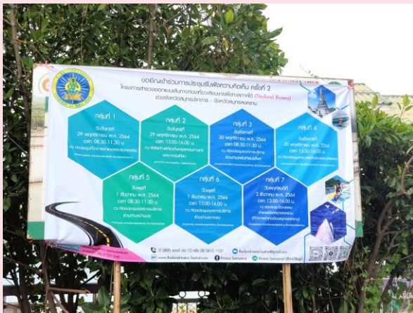
พิพิธภัณฑสถานแห่งชาตินครปฐม เขตบางขุนเทียน

ผู้ให้บริการงานจ้างออกแบบได้ดำเนินการประชาสัมพันธ์ก่อนการประชุมรับฟังความคิดเห็นครั้งที่ 2 ผ่านช่องทางต่างๆ ได้แก่ การประชาสัมพันธ์ผ่านป้ายและประกาศประชาสัมพันธ์โครงการ การประชาสัมพันธ์ผ่านใบปลิว การประชาสัมพันธ์ผ่านเว็บไซต์ ไลน์ และเพจเฟซบุ๊กโครงการ เพื่อให้กลุ่มเป้าหมายและผู้สนใจโครงการได้รับทราบข้อมูลโดยทั่วกัน แสดงดังตัวอย่างรูปภาพดังนี้