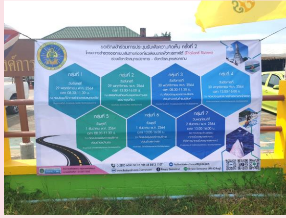
องค์การบริหารส่วนตำบลบ้านบ่อ