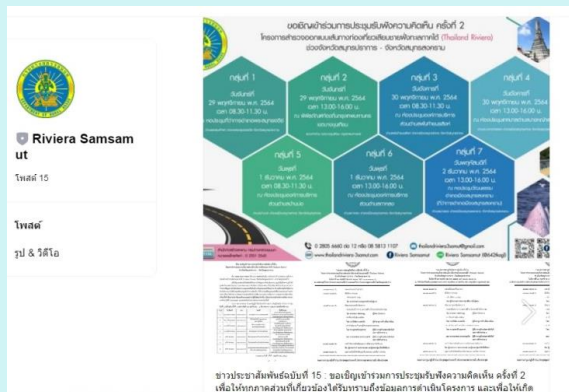
LINE : Riviera Samsamut (@642tkag)